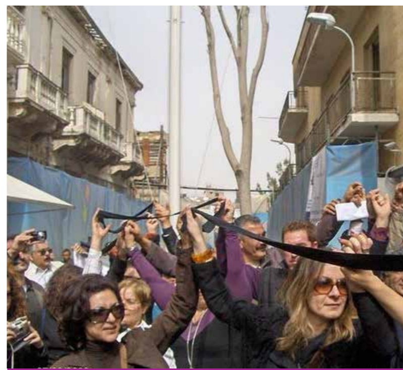
Δικαιοτική Πορεία για την Ελπίδα και την Αλήθεια, 7 Μαρτίου 2009